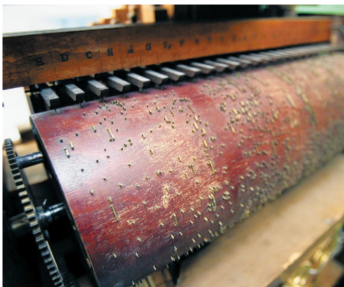
Speichermedium: Kleine Messingstifte auf der rotierenden Stiftwalze öffnen die zu den einzelnen Orgelpfeifen führenden Ventile.

dann den insgesamt 39 hölzernen Orgelpfeifen zugeleitet. Dafür, dass die richtige Pfeife zum richtigen Zeitpunkt pfeift, sorgt eine so genannte Stiftwalze, die ebenfalls durch das Zehn-Kilogramm Wind angetrieben wird. Auf