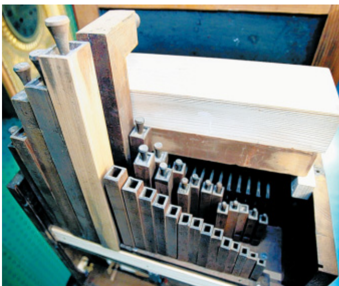
Da ist Musik drin: Insgesamt 39 aus Fichtenholz handgefertigte Orgelpfeifen befinden sich hinter dem Uhrwerk im Korpus der Standuhr.